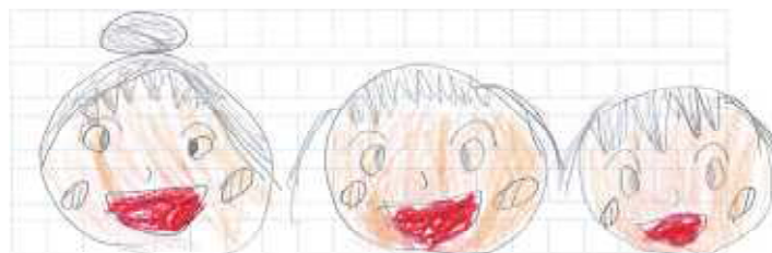
きしはた せんせい